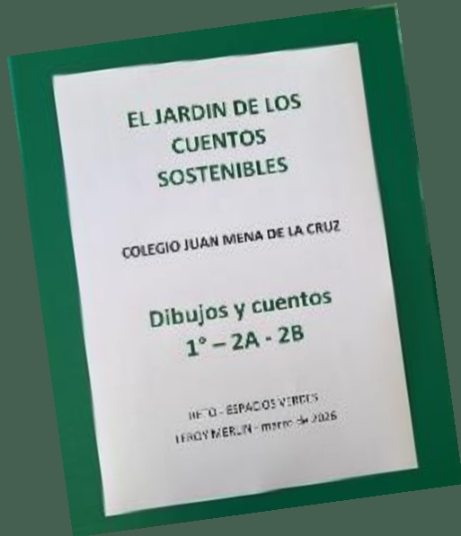
Libro de cuentos